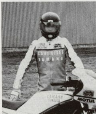
IDENTIFICATION : RD 350 LC Modèle 1984 COUPE GAULOISES YAMAHA